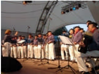
Shanty-Chor der Marinekameradschaft Heidenheim e. V.