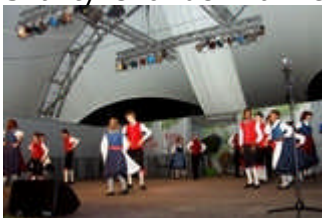
Schwäbische Trachtengruppe Heidenheim e. V.