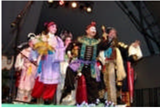
Tanz- und Musikgruppe aus Qianjiang "Jing Zhou flower drum opera troupe"