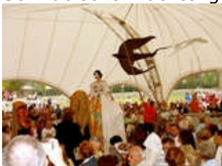
Theater "T.E.J.P." aus Jhilava