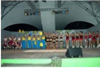
Faszination Sport Heidenheimer Sportbund 1846