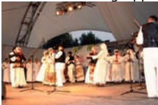
Gesangchor "Lipe"; Musikgruppe "HKUD RADOST SELA"