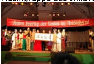
Tanz- und Musikgruppe aus Qianjiang "Jing Zhou flower drum opera troupe"