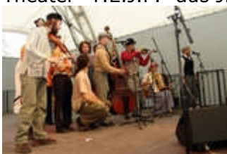
Musikgruppe aus Jhilava "Draga Banda" und "NENDETO"