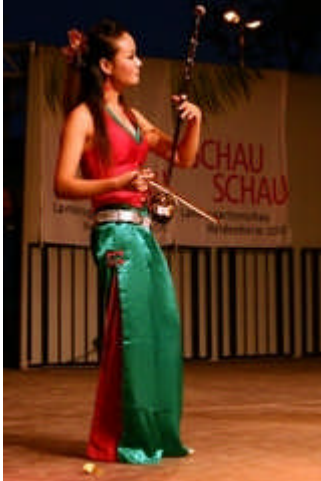
Tanz- und Musikgruppe aus Qianjiang "Jing Zhou flower drum opera troupe"