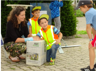
Die Glücksbringer beim Lose ziehen.